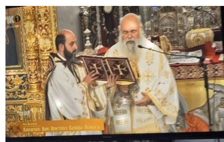
PIK 1 : Θ. ΛΕΙΤΟΥΡΓΙΑ, ΚΑΘΕΔΡΙΚΟΣ Ι. ΝΑΟΣ ΑΠΟΣΤΟΛΟΥ ΒΑΡΝΑΒΑ ΛΕΥΚΩΣΙΑΣ, ΚΥΡΙΑΚΗ 13-7-2025

Μαζί με τα ανάμεικτα και αντιφατικά αισθήματα θλίψης και ελπίδας που δημιουργήθηκαν όταν είδα τις πιο πάνω φωτογραφίες που έχουν κατακλείσει το θρησκευτικό internet ήλθε στο νου μου και η παροιμία: « Με ήλιο τα 'βγαζα, με ήλιο τα 'βαζα, τι έχουν τα έρμα και ψοφάν; ».